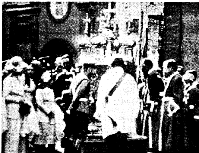
Государь Императоръ изволилъ осматривать старинный «ходовой» фонарь у Рождественскаго собора г. Суздаля.