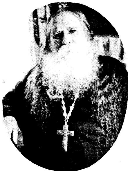
Протоиерей Никита в последние годы жизни