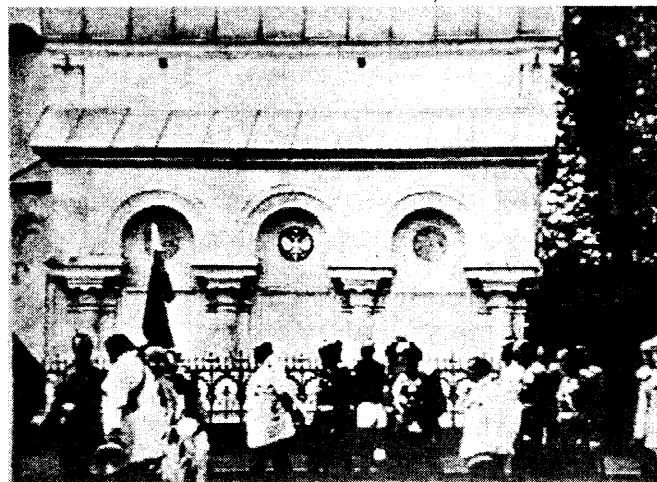
Государь, Августейшие Дочери и члены свиты Его Величества возле часовни над могилой Князя Дмитрия Пожарского в Спасо-Евфимиевском монастыре.

Выслушав этот потрясающий воображение рассказ, Государь проникся глубоким сочувствием к судьбе Великого князя, по сути дела - первого Русского Царя, который стремился к укреплению Государства, Самодержавия, Православия - и был убит своими холопами-заговорщиками.