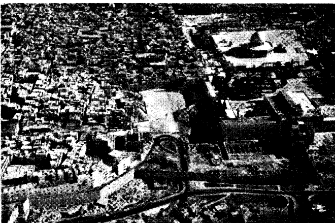
Иерусалим с высоты птичьего полета