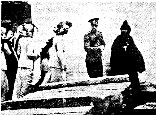
г. Суздаль. Покровский монастырь. Государь Император изволит осматривать старинные надгробные плиты на могилах инокинь.

По отбытіи ЕГО ВЕЛИЧЕСТВА изъ гор. Суздаля, въ соборномъ храмѣ, въ монастырскихъ храмахъ и во всехъ приходскихъ совершено было молебствіе