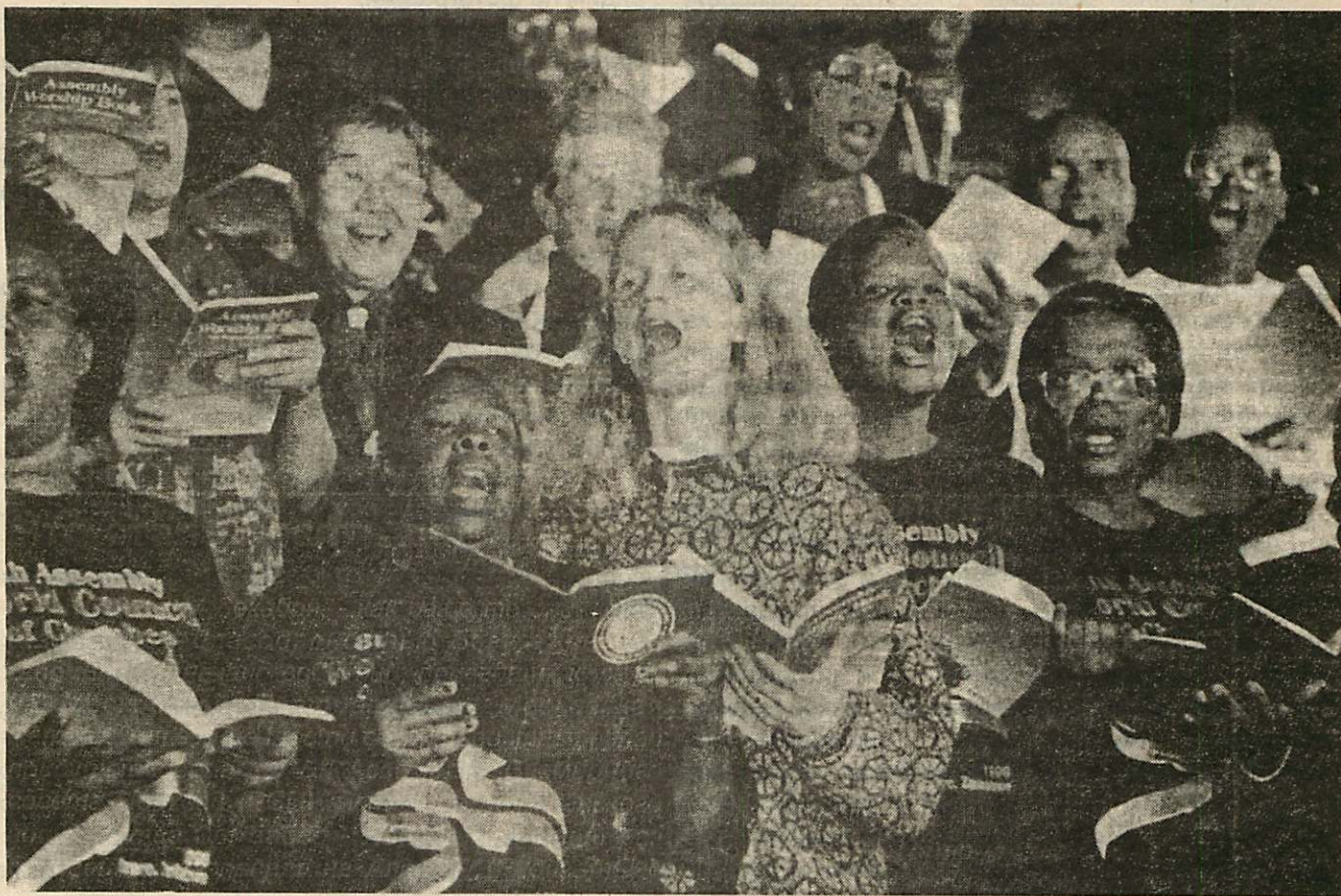
Утренняя молитва. Хараре.

Из вышеприведенной публикации, подготовленной по материалам Журнала Московской Патриархии, явствует, что Московская Патриархия привержена именно экуменическим идеалам: это ее мировоззрение, ее дух - утробный дух мира сего, который она разделяет не только с экуменическими религиозными, но и с так называемыми деятелями "культуры." Достаточно ясно, с присущим ему талантом, который он целиком обратил на службу Веельзевулу, так выразил это кощунственное мировоззрение, с которым солидаризировалась Московская Патриархия, известный писатель Виктор Ерофеев: