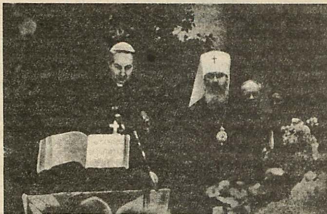
Со-председатели ассамблеи архиепископ Миланский Карло Мария кардинал Мартини и митрополит Ленинградский и Новгородский Алексей во время заключительного экуменического богослужения (Фото и подпись из ЖМП № 9 за 1989 г., стр. 59).

“Стремление к максимальной открытости выразилось и в программе базельского форума. Он