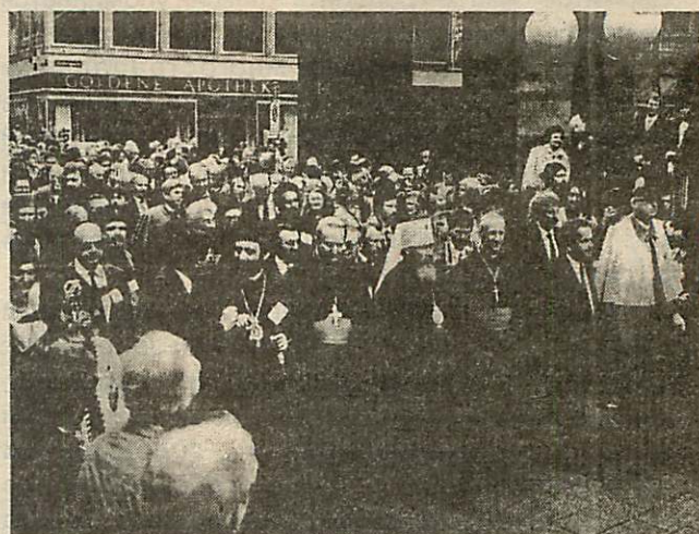
Участники базельского форума, жители города и гости прошли по улицам Базеля, совершив путь, соединивший храм, рыночную площадь и место заседаний ассамблеи

То есть не могут быть разделены Церковь и рыночная площадь? Что бы означали эти слова “крупного богослова” (как он был назван в юбилейном адресе)?