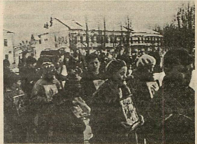
Крестный ход учащихся воскресной школы в Великую Пятницу