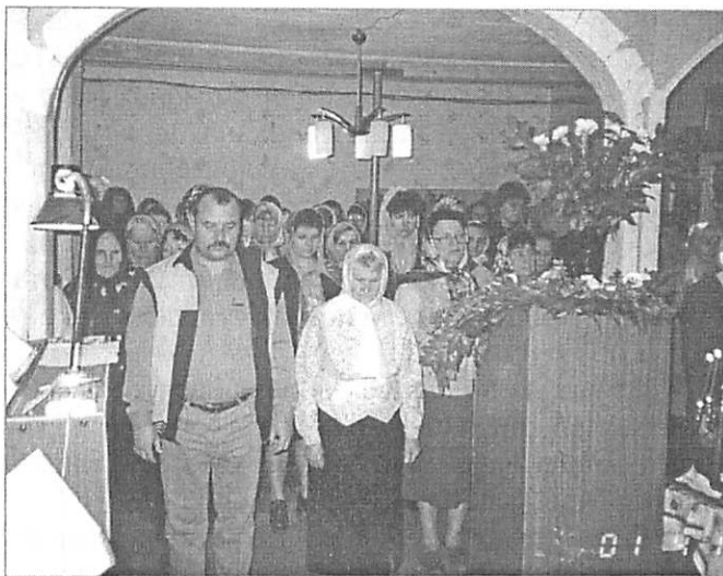
Прихожане общины Св. Архангела Михаила в Волгограде