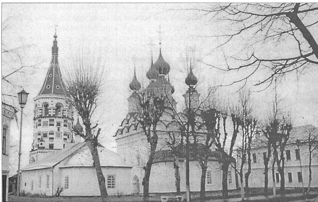
Суздаль. Храмы Св. праведного Лазаря и Священномученика Антипы