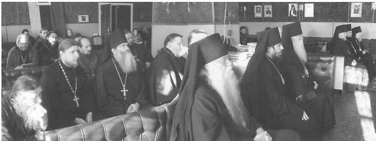
Епархиальный Съезд заслушивает выступления докладчиков