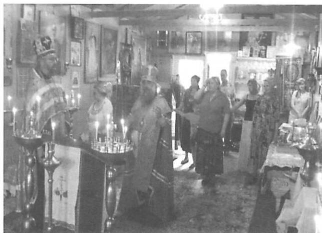
Всенощное бдение св. княгине Ольге