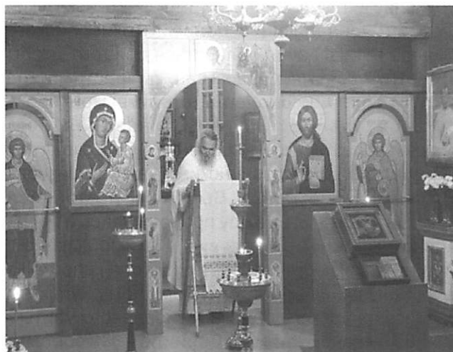
Современный интерьер храма Новых Мучеников Российских в Москве

Отвергает епископ Гавриил и все остальные аргументы митр. Агафангела против церковно-канонической позиции РПЦЗ МП. Известную анафему на ересь экуменизма, принятую Архиерейским Собором РПЦЗ 1983 г., он считает имеющей значение только для РПЦЗ и не распространяющейся на Московскую патриархию. При этом епископ указывает на постоянные просьбы со стороны первоиерарха РПЦЗ МП митрополита Илариона о выходе РПЦ МП из Всемирного совета Церквей. На обличения в “сергианстве” епископ Гавриил отвечает напоминанием об участии Митрополита Агафангела в украинской “Оранжевой революции” и о его сотрудничестве с мэром Одессы Гурвицем.