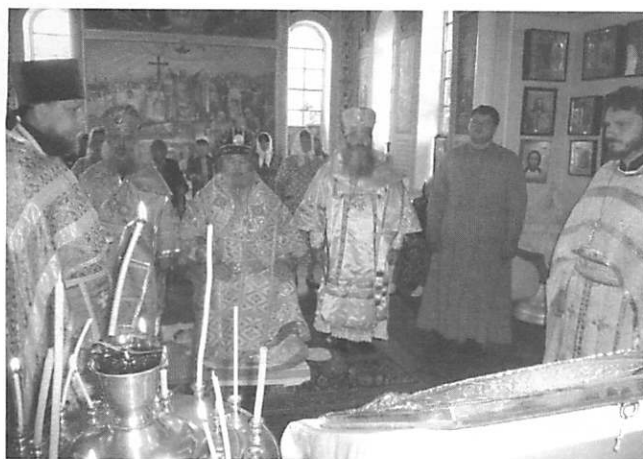
Литургия в престольный праздник Казанского храма в ст. Отрадная

Феодор вместе с прихожанами совершил особое молебное пение с благословением церковных колоколов, древних «кампанов», подвешенных посреди двора. После чина благословения каждый из прихожан мог позвонить в колокола, возвещая небесам и земле радость о нисшедшем