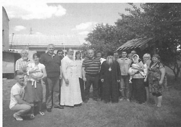
Преосвященные архиереи с прихожанами Петропавловского храма в с. Советка