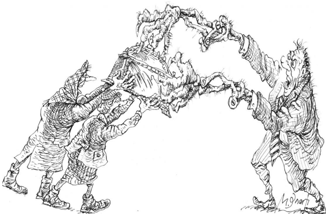
Художник: Михаил Златковский

Митрополит Феодор как-то спросил Кострову, как она себе представляет процедуру передачи мощей. Та разъяснила первоиерарху, что он должен своими руками вскрыть раки-гробницы, снять с усопших святых все одежды, расчленив их останки – чтобы можно было