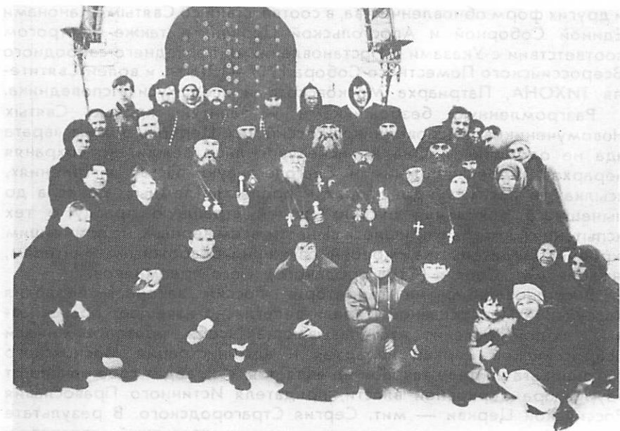
После Архиерейский хиротоний в Цареконстантиновском соборе г. Суздаля.